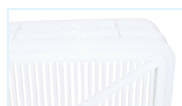
Feritorie fondo / bottom perforations Dim. 65x4 mm