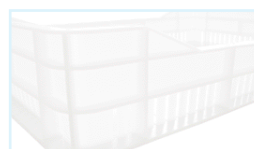
Feritoie / perforations Dim. 28x5 mm