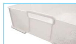
Particolare della PC10 Details of PC10

Tutte le casse "TAL F6646" - "AC2" - "PF10-PC10" possono essere personalizzate con marchio a caldo All boxes of "TAL F6646" - "AC2" - "PF10-PC10" and of are customizable by hot printing