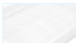
Base interna / internal bottom