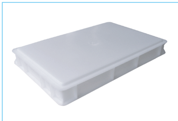
Particolare del fondo